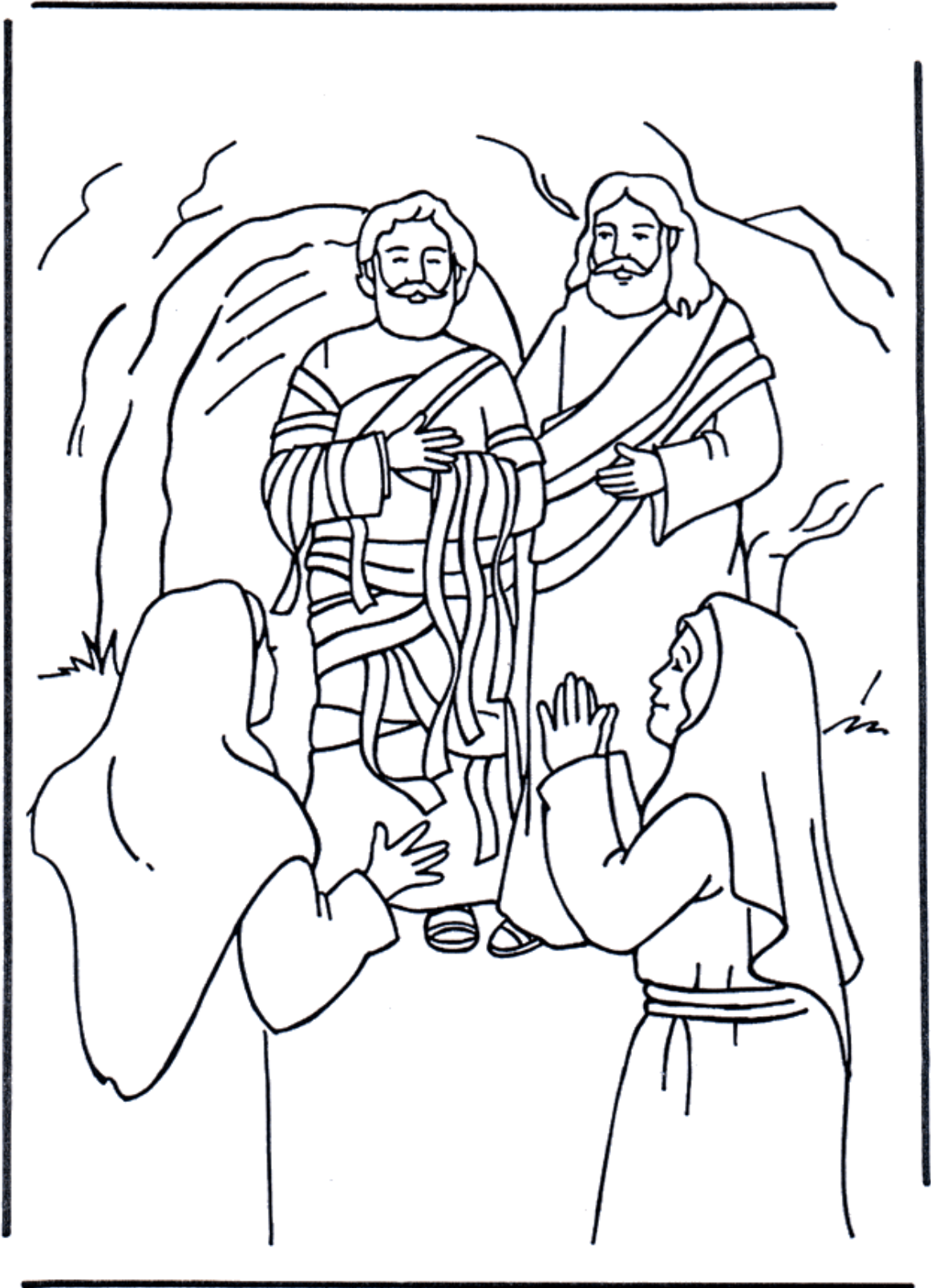
Opwekking van Lazarus